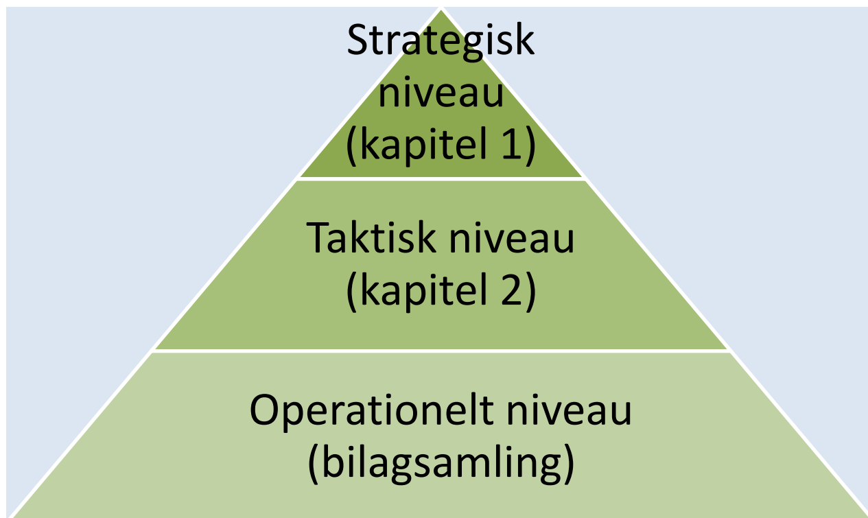
Figur 1. Niveauer af kvalitetsarbejdet fordelt på notatets kapitler og bilag.

Notatet er inddelt i tre niveauer: det strategiske, taktiske og operationelle niveau (se figur 1). Hvert niveau er forsøgt fastholdt i bestemte kapitler og i bilagsamlingen.